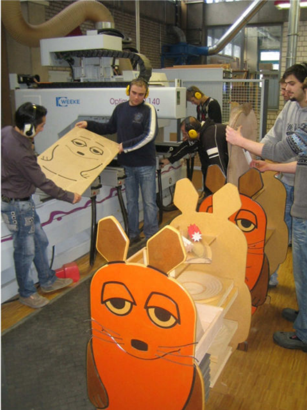
Einrichten des CNC - Bearbeitungszentrums